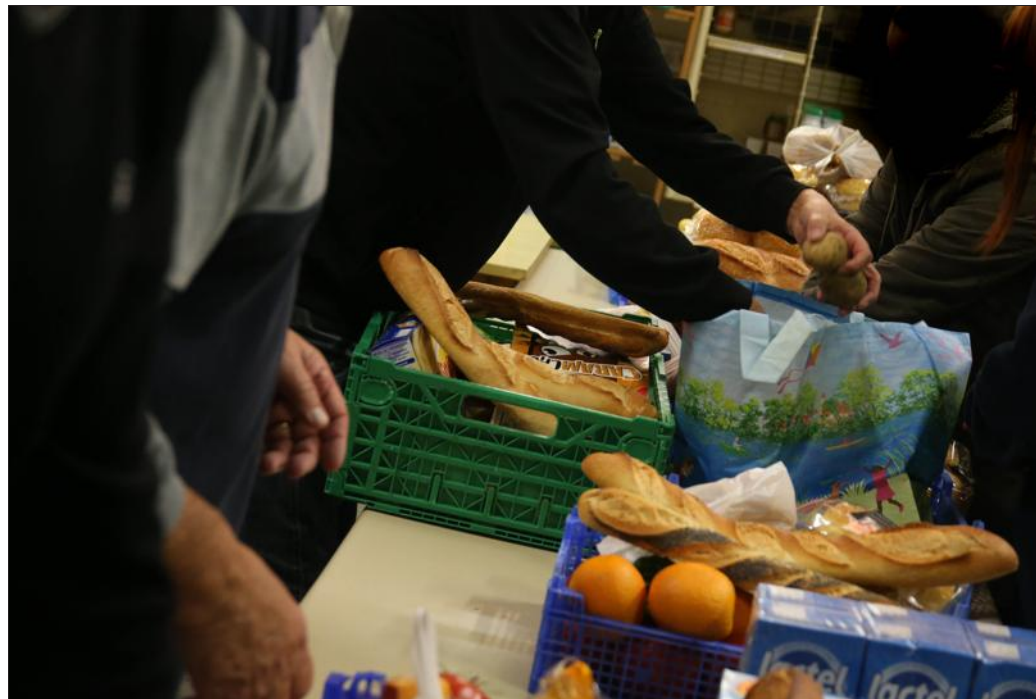
Le cœur de l'action, pour les associations caritatives de la Vallée, reste l'aide alimentaire d'urgence, tout en assurant le lien avec les personnes isolées.

« Entre Secours populaire, Restos du cœur et Secours catholique, nous n'avons pas attendu le confinement pour mettre en place une complémentarité dans nos